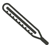
Fièvre > 38°C