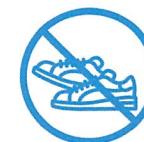
J'évite les efforts physiques