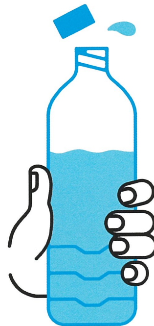
JE BOIS RÉGULIÈREMENT DE L'EAU