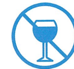
Je ne bois pas d'alcool