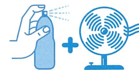
Je mouille mon corps et je me ventile